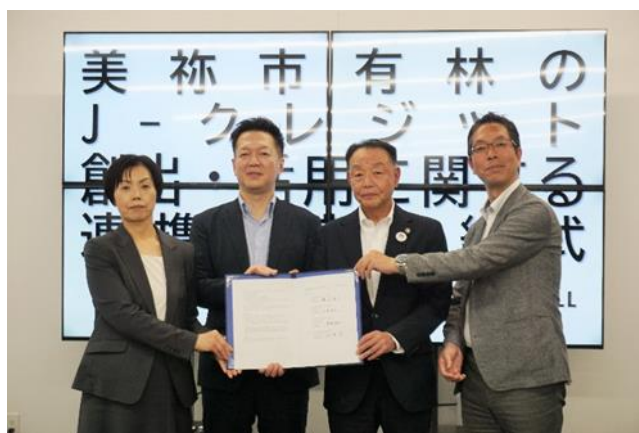
(左から 山口銀行 大本執行役員、YMF Gグロースパートナーズ 禅院社長、美禰市 篠田市長、バイウィル 下村社長)